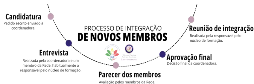
Figura 1 - Processo de integração de novos membros.

A integração de novos elementos no grupo de trabalho da REDE PT é feita por convite direto ou por intenção da pessoa que envia o seu pedido por escrito. A seleção faz-se por entrevista com a coordenadora e outro membro, habitualmente a responsável pelo núcleo de formação, e ainda com o parecer dos membros, sendo a aprovação final do novo membro da responsabilidade da coordenadora da REDE PT. A Fig. 1 esquematiza este processo.