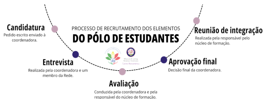
Figura 2 - Processo de recrutamento dos elementos do polo de estudantes.